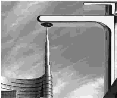
Rubinetto che sostiene il palazzo di piazza Gae Aulenti

BRERA DISTRICT | LABORATORI CREATIVI ALLA RICERCA DI NUOVI LINGUAGGI